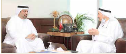
رئيس المجلس الأعلى للصحة يستقبل وزير المالية

الوطني مستجدات برامج تطوير قطاع الرعاية الصحية في المملكة، وفي مقدمتها برنامج الضمان الصحي الوطني (صحتي)، والمشروعات والمبادرات القائمة لتطوير المنظومة الصحية المتميزة في المملكة وفق أعلى مستويات الجودة والعدالة والتنافسية وبما يعود بالخير والنفع على الجميع.