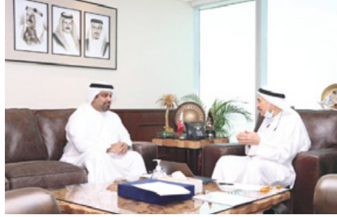
حمد بن عيسى آل خليفة ملك البلاد والمعتز بما يوليه جلالته من رعاية واهتمام بالقطاع الصحي، منوهين بالمتابعة المستمرة لصاحب

السمو الملكي الأمير سلمان بن حمد آل خليفة ولي العهد رئيس مجلس الوزراء لكافة المشاريع التي من شأنها تطوير جودة الخدمات الصحية. واستعرض رئيس المجلس الأعلى للصحة مع وزير المالية والاقتصاد الوطني مستجدات برامج تطوير قطاع الرعاية الصحية في المملكة، وفي مقدمتها برنامج الضمان الصحي الوطني «صحتي»، والمشاريع والمبادرات القائمة لتطوير المنظومة الصحية المتميزة في المملكة وفق أعلى مستويات الجودة والعدالة والتنافسية وبما يعود بالخير والنفع على الجميع.