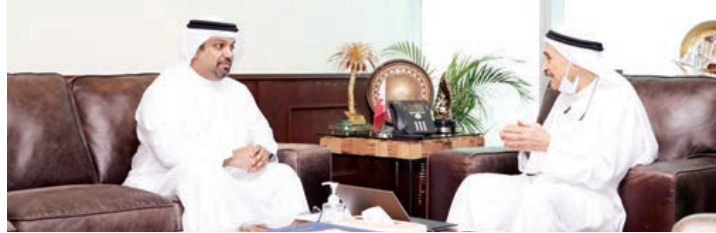
○ جانب من لقاء رئيس المجلس الأعلى للصحة ووزير المالية.