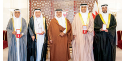
○ سمو ولي العهد رئيس مجلس الوزراء خلال لقاء رؤساء تحرير الصحف المحلية وتسليمهم وسام الأمير سلمان بن حمد للاستحقاق الطبي.