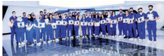
○ جانب من حفل التخرج.

المفخرة بنجاح ومدتها اثنا عشر شهراً من التدريب السريري، وهي فترة مكتملة لدراسته الطب ولا يعتبر الطالب مؤهلاً لممارسة مهنة الطب إلا بعد إتمامها بنجاح مؤكدة أن من أهم أهدافها هي تنمية وتطبيق المعلومات الطبية من خلال التدريب السريري، تدريب طبيب الامتياز على الاستقلالية في العمل والقدرة على اتخاذ القرار والتعامل بكفاءة مهنية. تدريب طبيب الامتياز على الانسجام في نظام العمل ضمن الفريق الطبي ومعرفة حدود إمكانياته وقدراته وتدريبه على طلب المشورة ممن هم أكثر منه خبرة، تعزيز الطبيب على أسلوب التعامل الصحيح مع المريض وذويه، تدريب الطبيب على مهارات التواصل ومهارات الإنشاء ويضع المهارات الإدارية وتطبيق الأخلاقيات الطبية المهنية. واختتمت فعاليات الحفل بتكريم المقومين من المتدربين وتقديم شهادات تقديرية لهم لجهودهم خلال الفترة التدريبية.