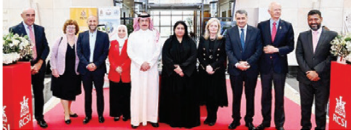
○ جانب من حفل تدشين المشروع.